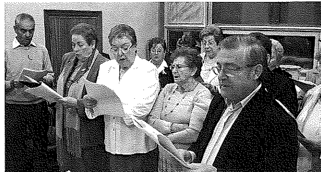
La missa que es va celebrar per cloure la segona edició de la Setmana del Major va comptar amb la col·laboració del cor dels jubilats.