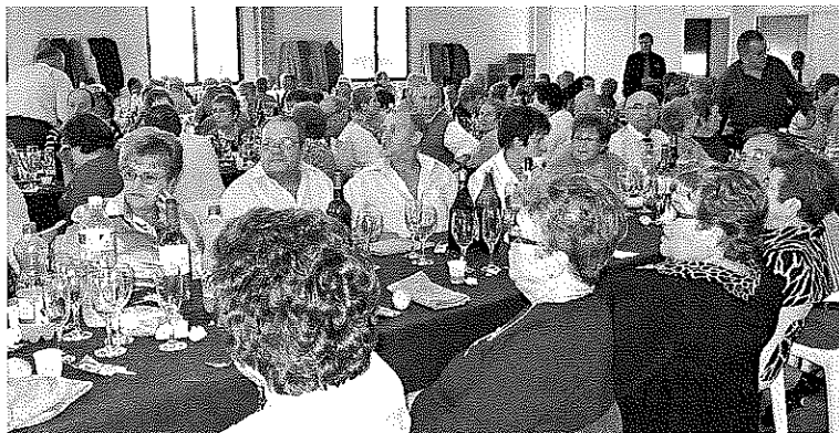
La llar de jubilats es va omplir de gom a gom per acollir el dinar de germanor, que va tancar els actes organitzats dins de la II Setmana dels Majors.