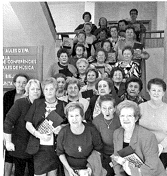
Foto de família de les autores de receptari de cuina "Hui dinem en ca la iaia", que va ser presentat a la Casa de la Cultura, del qual ja s'ha esgotat la primera edició.

El regidor de Benestar Social i Tercera Edat, vol deixar patent que l'èxit d'esta segona Setmana del Major radica en la implicació de l'Associació de Jubilats, i especialment en el treball de la seua junta. "Estic plenament satisfet amb el desenvolupament de la II Setmana del Major. El resultat ha sigut molt satisfactori, i el grau de participació en les activitats molt alt. Aprofite per donar l'enhorabona a l'Associació de Jubilats, però molt especialment, per a fer constar el meu reconeixement als membres de la junta, que al llarg de tot l'any s'han coordinat amb el seu regidor i han demostrat una gran capacitat de treball i d'organització. Els anime a que continuen així, i seguiscuen demostrant-nos a tots que els majors d'Agullent encara tenen molt a dir i molt a fer" .